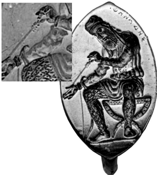
Мал. 3. Зображення скіфа зі стрілою на електровому персні з Пантікапею, IV ст. до н.е. (Ермітаж, Інв. № П.1854.26)

Отже, огляд використання терміна aiiah- «залізо» в авестійській мові показав доволі широкий спектр його використання як іменника в Яснах (9, 11; 11, 7; 30, 7; 32, 7; 51, 9), Яштах (10, 96; 13, 2) Відевдаті (5, 38) та прикметника aiiaṇhaēna- «залізний» у Відевдаті (4, 50, 51; 6, 46; 7, 74; 9, 14; 16, 6) та 10-му Яшті (10, 131), так і як частини у різних компаундних прикметниках ( Яштах 10, 70; 13, 45, 112; Відевдаті 8, 89; 14, 9). Контекст використання вказує на низку семантичних аспектів концепту заліза- aiiah . В Яснах 30, 7; 32, 7; 51, 9 та Яшті 17, 20 aiiah- набуває есхатологічного значення «розтопленого металу». В Ясні 11, 7 та Яшті 13, 2 залізо є елементом космологічного опису. В Ясні 9, 11 цей термін виступає у міфологічному контексті. У Відевдаті 5, 38 та 8, 89 aiiah- фігурує в ритуальних формулах. В Яшті 10, 70 із залізом асоціюються частини тіла вепра, тобто воно набуває релігійно-міфологічної семантики, оскільки вепр вважався втіленням військового божества Веретрагни. В Яшті 13, 112 aiiah- є частиною власного імені.