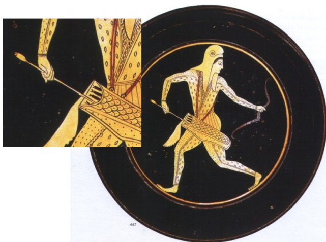
Мал. 2. Зображення скіфа-лучника на червонофігурному блюді з Афін, VI ст. до н.е., (London British Museum GR 1837.6-9.59)