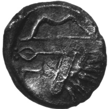
Мал. 4а-б. Зображення стріли на боспорських тетрадрахмах, 300–275 рр. до н.е.

Закономірними та поширеними є контексти, пов'язані з військовим зброєю та спорядженням. За Яштом 10, 131 із заліза виготовлені булави, а зброя Мітри – з жовтого заліза (бронзи?) ( Яшт 10, 96). Із заліза- aiiaha , зокрема, виготовлені шоломи, зброя та броня воїна ( Яшт 13, 45), наконечники стріл ( Відеват 14, 9). Натомість, було з'ясовано, що традиційне в іраністиці залучення до тексту Яшту 10, 129 слова aiiaṇhaēna («залізний»), як коректури aṇhaēna за пізнім рукописом М12, є неправомірним, оскільки вносить фантастичні риси до реального й унікального для корпусу Авести опису структури стріли з вказівкою на кістяний хвостовик.