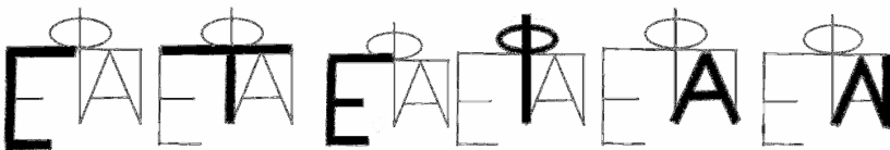
Мал. 3. Читання складної монограми

Автентичність рідкісних срібних монет із зображенням Афіни, списа, круглого щита, складної монограми й напису ОΛΒΙΟ-ΠΟΛΙ переконливо доведена В.А. Анохіним 37 та В.І. Наумовим 38 . П.О. Каришковський 39 вказував на нехарактерну для Ольвії складність монограми й розрізняв у ній літери Ε, Φ, Π, Α, Ι, які В.А. Анохіним 40 прочитані як Ἐπιφάνης. Разом з тим В.І. Наумов, як доказ автентичності монет, відзначив складність монограм на синхронних монетах Боспору доби Мітридата VI Євпатора; дослідник розрізняє в монограмі майже всі літери імені Епафродіт 41 . На нашу думку, інтерпретація монограми іменем, не відомим раніше в Ольвії (ім'я Ἐπαφροδίτης у Північному Причорномор'ї зафіксоване лише в II в. н.е. у Горгіппії й Пантікапеї) 42 , не має достатніх підстав. Монограма однозначно ототожнюється нами з ім'ям ΣΤΕΦΑΝ, що є ще одним доказом автентичності досліджуваних монет (мал.3). Важливим аргументом, що підтверджує справедливість запропонованої інтерпретації, є те, що літери ΣΤΕΦΑΝ по ходу читання переміщуються з лівої в праву частину монограми. На базі монограми Стефана й з урахуванням спільного розгляду матеріалів по синхронізованому третьому стовпцю календаря IosPE I 2 201 уточнено датування лапідарних написів, що згадуються вище, як близьких до 105 р. до н.е. і уточнено статус Стефана в Ольвії, як першого та, мабуть, неофіційного представника Мітридата VI Євпатора.