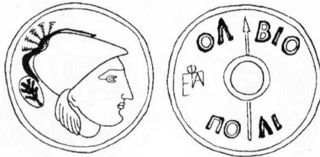
Мал.2. Срібна монета зі складною монограмою