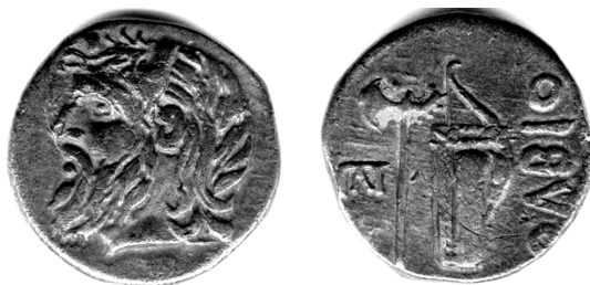
Мал.1 Перший випуск борисфенів. Монограма Калініка Євксенова

декрету IosPE I 2 25+31 видавцями. Більше того, на підґрунті синхронності подій і просопографічних відповідностей «замикається» коло відомих фактів і виникає припущення, що в розглянутій нами монограмі приховане ім'я Калініка Євксенова, при цьому, монограму слід читати не як ЕК, а навпаки, як КЕ, тобто К[αλλίνικος] Ε[υξένου].