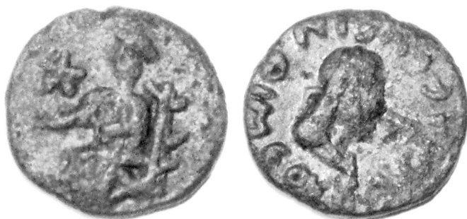
Илл. 2. Двойной денарий Ининфимея (234/235-238/239)