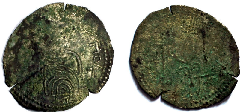
Рис. 5. Сребреник Святополка (Дополнение № 465)