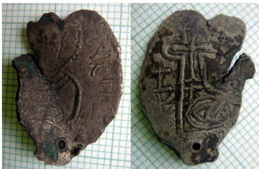
Рис. 7. Сребреник Святополка (Дополнение № 469)