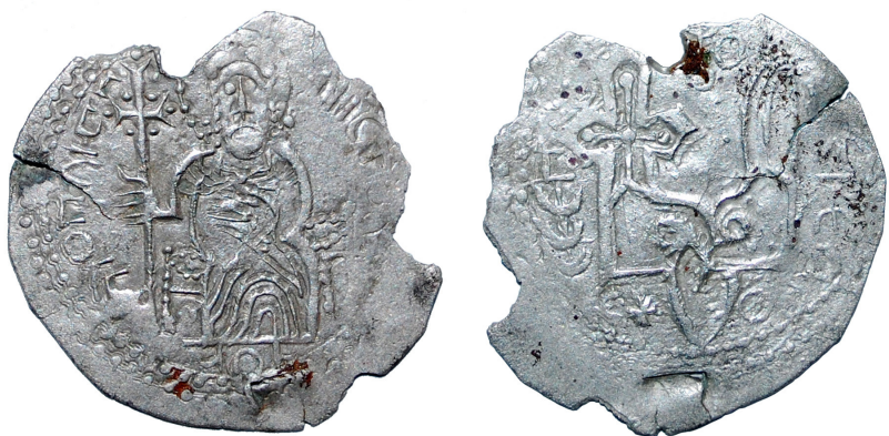
Рис. 6. Сребреник Святополка (Дополнение № 466)