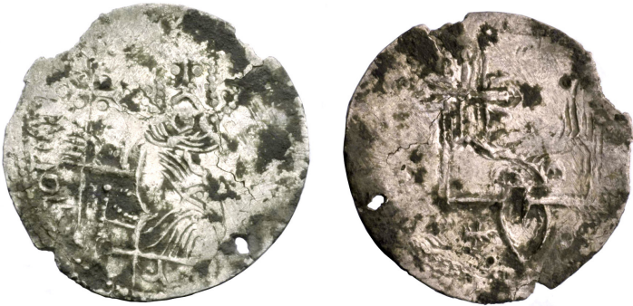
Рис. 4. Сребреник Святополка (Дополнение № 462)