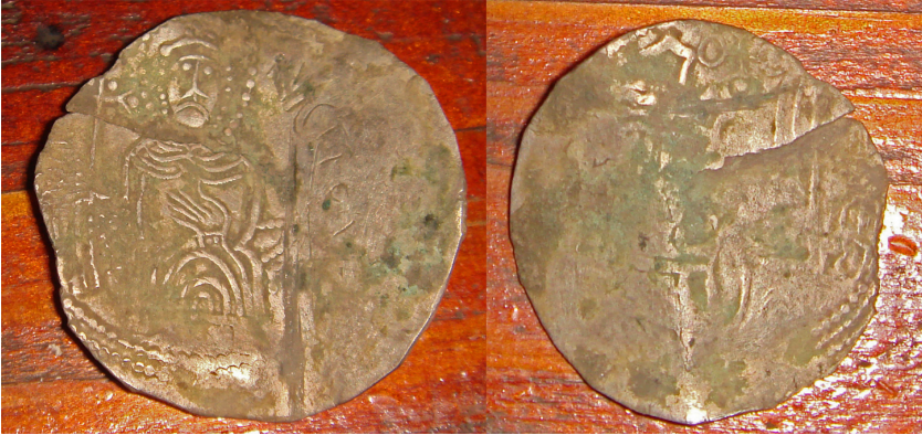
Рис. 2. Сребреник Святополка (Дополнение № 295)