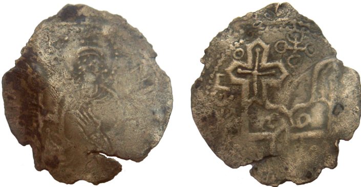
Рис. 3. Сребреник Святополка (Дополнение № 336)