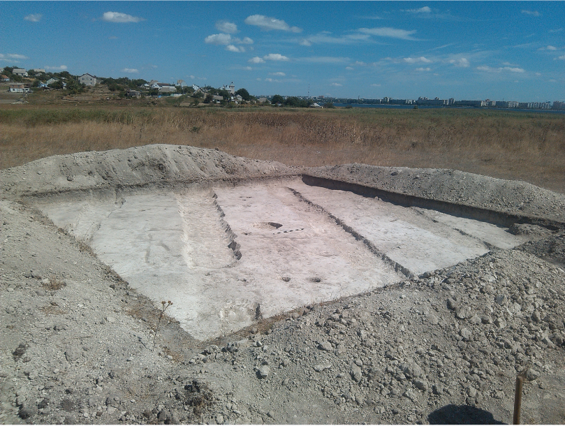
Мал. 1 Вид розкопу з Південного-заходу.