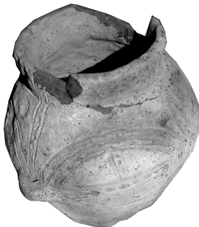
Рис. 2. Горщик, знайдений біля с. Яковлівки