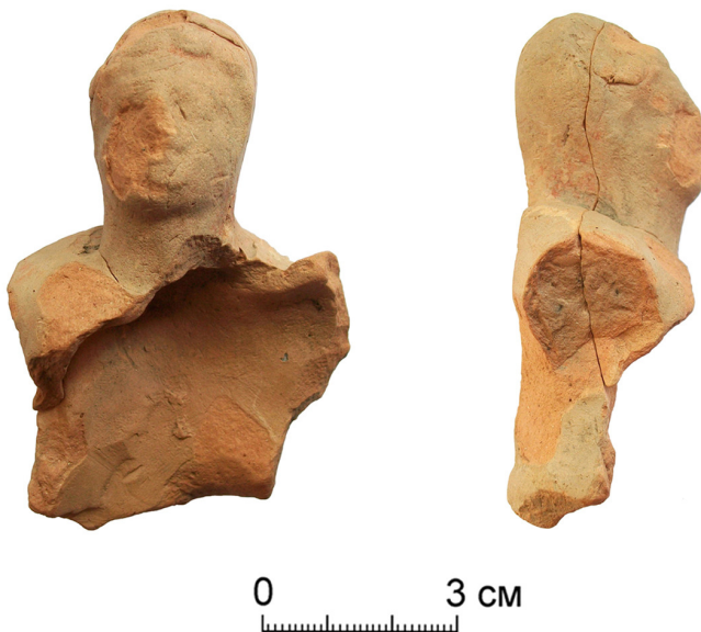
Рис. 1. Фрагмент статуэтки римского воина из Картала