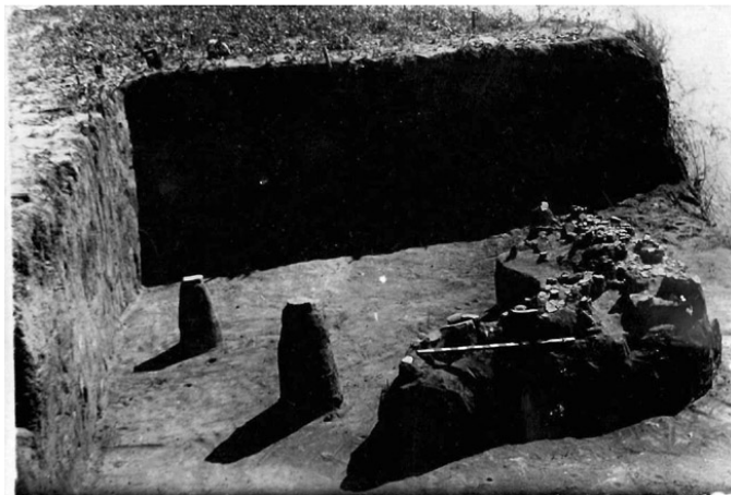
Рис. 2. Фото об'єкту у квадраті 3А з наукового архіву ОАМ (ОГИМ 69040/59)