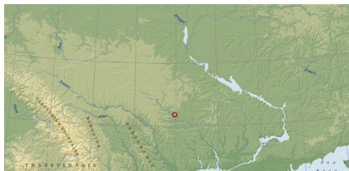
Рис. 1. Розташування поселення Лозувата-І

скіфів та сарматів 5 , слов'ян 6 та германців. Придонна частина ліпного горщика (рис. 2: 11) за такою морфологічною ознакою, як наявність гарно вираженої придонної закраїни, також може знаходити аналогії серед кераміки пізньо-скіфосарматських типів 7 . Від аналогічних форм слов'янського посуду даний фрагмент відрізняє відсутність у керамічному тісті великих фракцій (0,4–0,9 см) шамоту, розосередженого по всій площі посудини.