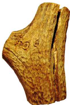
Рис.1. Виріб з рогу оленя