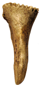
Рис.2 Знаряддя для тиснення шкіри