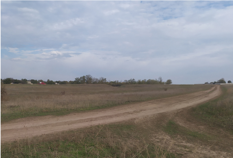
Рис. 4. Остатки дамбы-моста у с.Червоное Парутино (вид с запада)

Авторы осознают, что предложенная реконструкция части трассы одного из основных путей из Ольвии требует обоснования путем проведения полевых исследований с применением современных приборов и оборудования (геофизического, для аэрофотосъемки и т.д.). Обнадёживает, что такая практика уже дала результаты в самой Ольвии, где в 2014 г. на участке «Некрополь 7» была обнаружена геомагнитная аномалия. Ее раскопки ведутся с 2016 г. и показали наличие раннего оборонительного рва шириной до 5,0 и глубиной 2,4 м, который широким полукругом опоясывал городище и даже часть урочища Сто Могил по правому берегу б. Заячьей 29 . Отдельно следует решить проблемы датировки структурных элементов дороги, которые могут оказаться как поздними, так и более ранними.