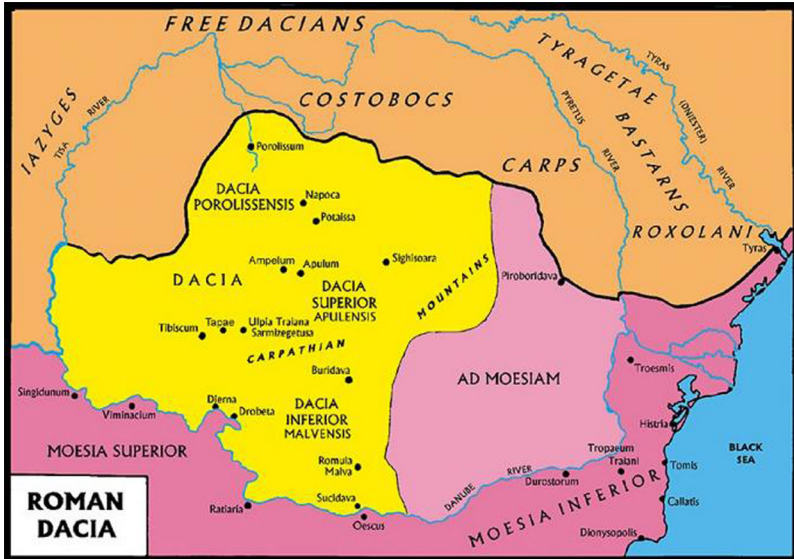
Figure 1. Map of Roman Dacia.

Copies with red paint inscriptions are known.