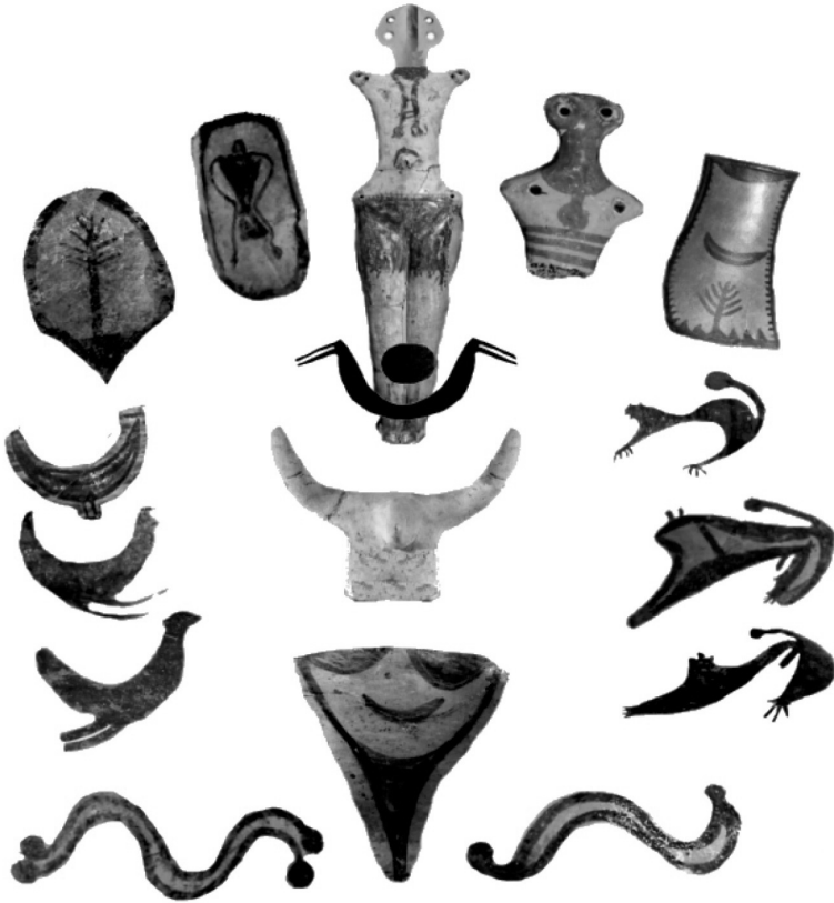
Рис. 2 . Контаминация сакральной символики Триполья в семантическом поле Луны.