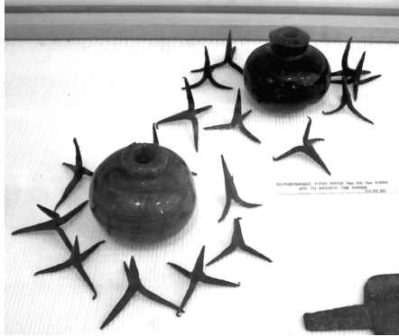
Посудини з «грецьким вогнем» і трибули з фортеці Ханья (X-XII ст.). Національний історичний музей, Афіни, Греція