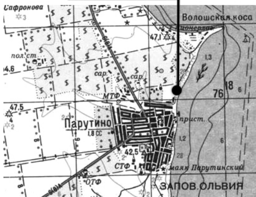
Таблица №1 место нахождения клада

Таким образом, на основе анализа обработанных монет мы можем сделать предварительный вывод, что клад носил накопительный характер и был собран в течение жизни одного поколения, приблизительно на протяжении 20–25 лет. Ранние группы монет более изношены, а поздние практически не были в хождении. Дальнейшая обработка клада позволит более полно провести его классификацию и систематизацию, ввести в научный оборот новый нумизматический материал, относящийся к выпуску чеканных монет Ольвии конца IV – начала III в. до н.э.