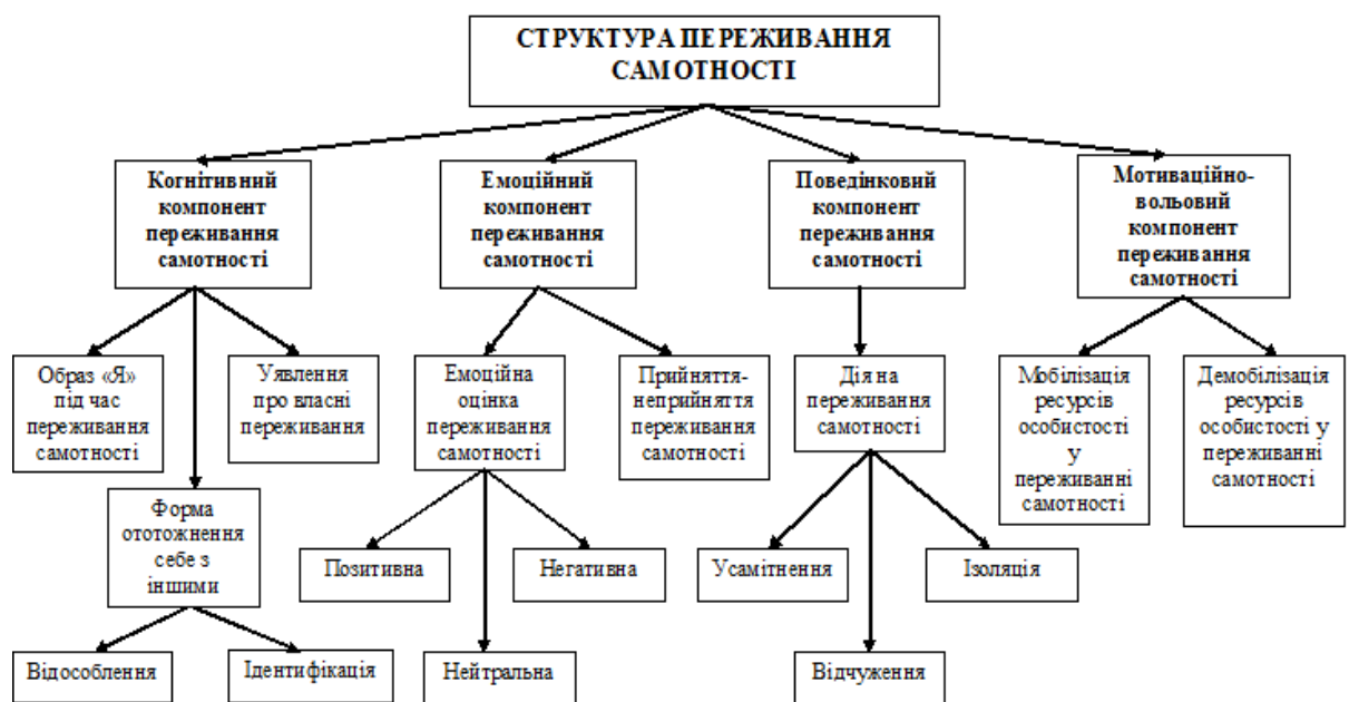
Рис. 1. – Теоретична структурно-функціональна модель переживання самотності

Таким чином, на основі принципів та категоріального апарату системного підходу самотність розглянуто як єдину систему, цілісність якої забезпечується тим, що переживання самотності функціонує на основі взаємодії таких компонентів, як когнітивний, емоційний, поведінковий та мотиваційно-вольовий (рис. 1.). Дані компоненти переживання виступають елементами (підсистемами) переживання самотності.