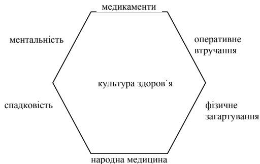
Рис. 1. Соціальні комунікації в системі здоров'я

На рис. 1 наведена модель соціальних комунікацій закритого типу, де здоров'я визначається як система в результаті використання «медикаментів — оперативного втручання — фізичного загартування — народної медицини — спадковості — ментальності».