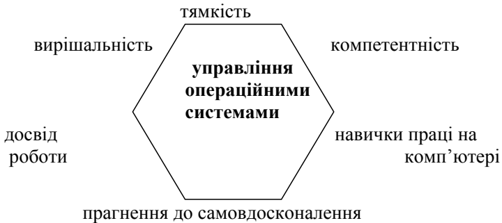
Мал. 3. Шестипозиційна замкнена модель соціальних комунікацій в системі «управління операційними системами і складання баз даних»

Стосовно цього переліку шестипозиційна модель соціальних комунікацій в системі «управління операційними системами і складання баз даних» має вигляд: