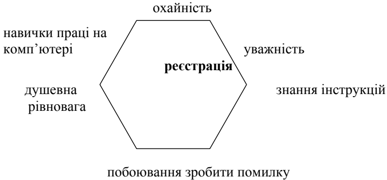
Мал. 1. Шестипозиційна замкнена модель соціальних комунікацій в системі «реєстрація документів»

Стосовно цього переліку шестипозиційна модель соціальних комунікацій системи «реєстрація документів»: