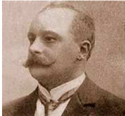
• Ланге Н.Н.

торию экспериментальной психологии в России и в Украине, отделенную от кафедр психиатрии, физиологии, философии.