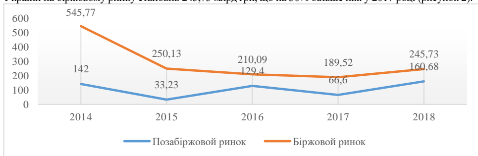
Рисунок 2. Обсяг торгів державними облигаціями України на біржовому та позабіржовому ринках у 2014 – 2018 роках, млрд. грн.

Якщо розглядати в абсолютних величинах, то у 2018 році обсяг торгів державними облигаціями України на біржовому ринку становив 245,73 млрд грн, що на 30% більше ніж у 2017 році (рисунок 2).