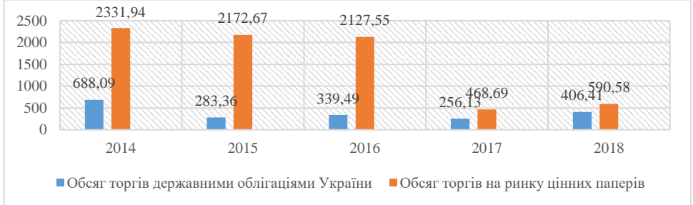
Рисунок 1. Обсяг торгів державними облігаціями у 2014 – 2018 рр., млрд. грн.

Якщо проаналізувати ринок державних облігацій України, то у 2018 році обсяг торгів державними облігаціями України становив 406,42 млрд грн, що більше на 58,7% порівняно з 2017 роком (рисунок 1).