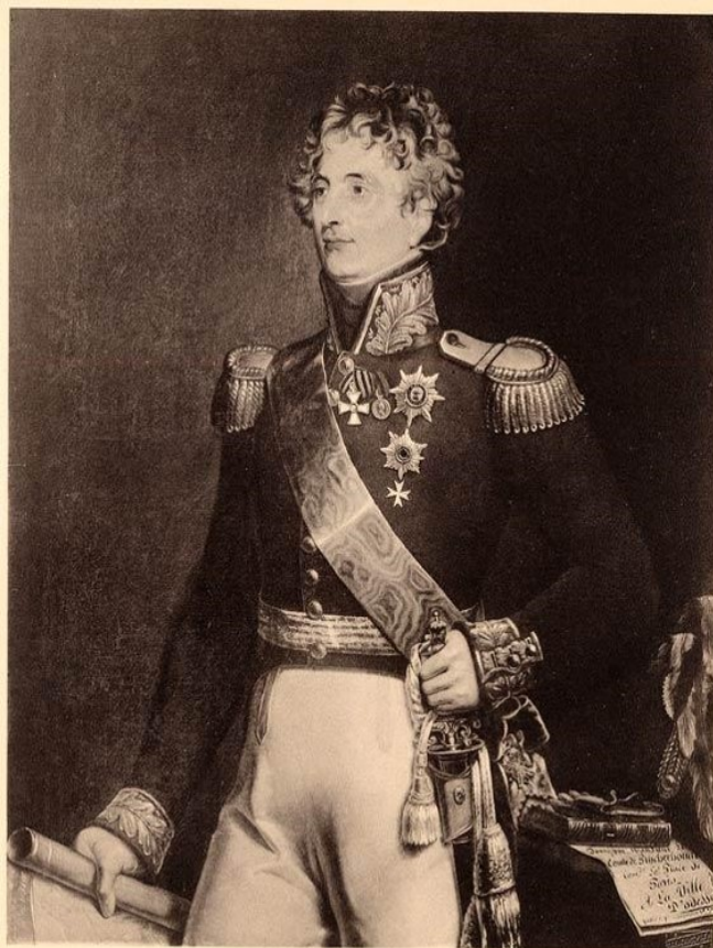
Ил. В. Губер