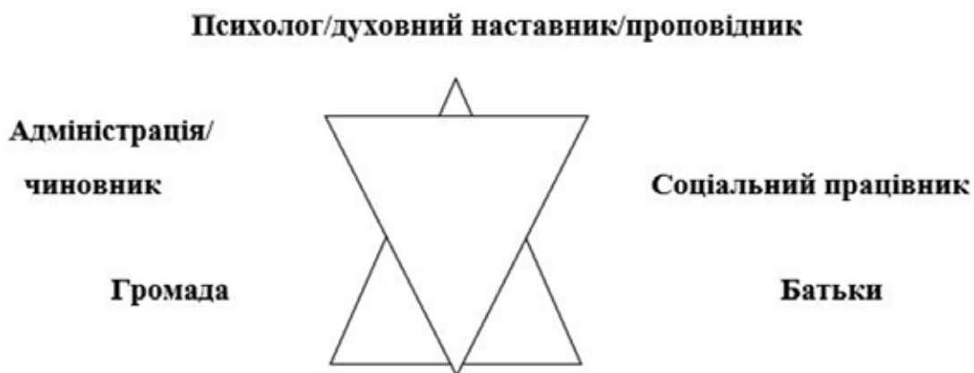
Рис. 5. Структура соціальної єдності

На відміну від наукових праць, письменник описує не лише додаткові факти, які не підлягають цензурі наукових відкриттів, а й містить глибину вірувань та традицій епохи. Науковий погляд учених дозволяє стверджувати, що відчуження, розрив зв'язків між світом батьків і дітей, дефіцит поваги до дитини, її індивідуальності, незахищеність від певних проявів середовища як факт соціального сирітства набув поширення з 50-х років ХХ століття. У науковій літературі використовується термін «соціальний сирота», що пов'язаний з ростом кількості «дітей вулиці». Натомість поет акцентує увагу на духовних причинах: непокорі, прагненню до втілення бажань, відмові від родинних принципів та правил роду як індикаторів поширення сирітства не лише серед дітей, батьків, а й творців