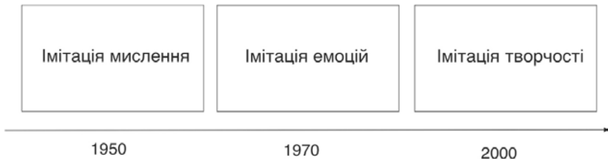
Рис. 1. Хронологія еволюції технологій штучного інтелекту у контексті соціально-психологічної парадигми

Найголовнішим, на нашу думку, атрибутом людського мислення є здатність до усвідомлення «абсурду» як результату існування парадоксів логіки. Будь-який результат для машини є результатом дії логічно зумовленого алгоритму, тому якщо алгоритм відбувся (операцію виконано), то цей результат не може містити логічної суперечності. Основою людського мислення є пошук суперечностей та природне прагнення до генерації абсурду, який на всіх етапах суспільної еволюції відігравав вирішальне значення науково-технічного, культурного та суспільного прогресу. У цьому плані здатність розуміти гумор у будь-якій його формі є швидким, але дуже дієвим способом ідентифікації людини в інформаційному просторі. Деякі прийоми на основі розуміння «абсурдів» уже використовуються