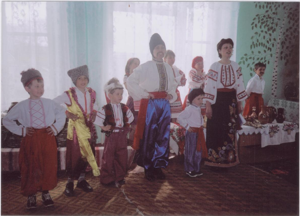
АДАМІ ВСЬКА СІЧ. ДИТЯЧИЙ САДОК.