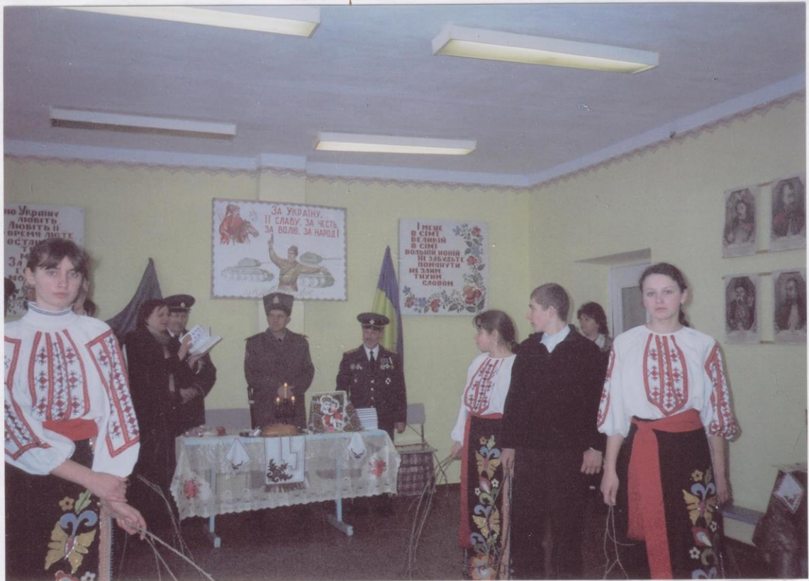
АДАМІВСЬКА СІЧ. ШКОЛА. ПРИЙОМ У КОЗАЧАТА.