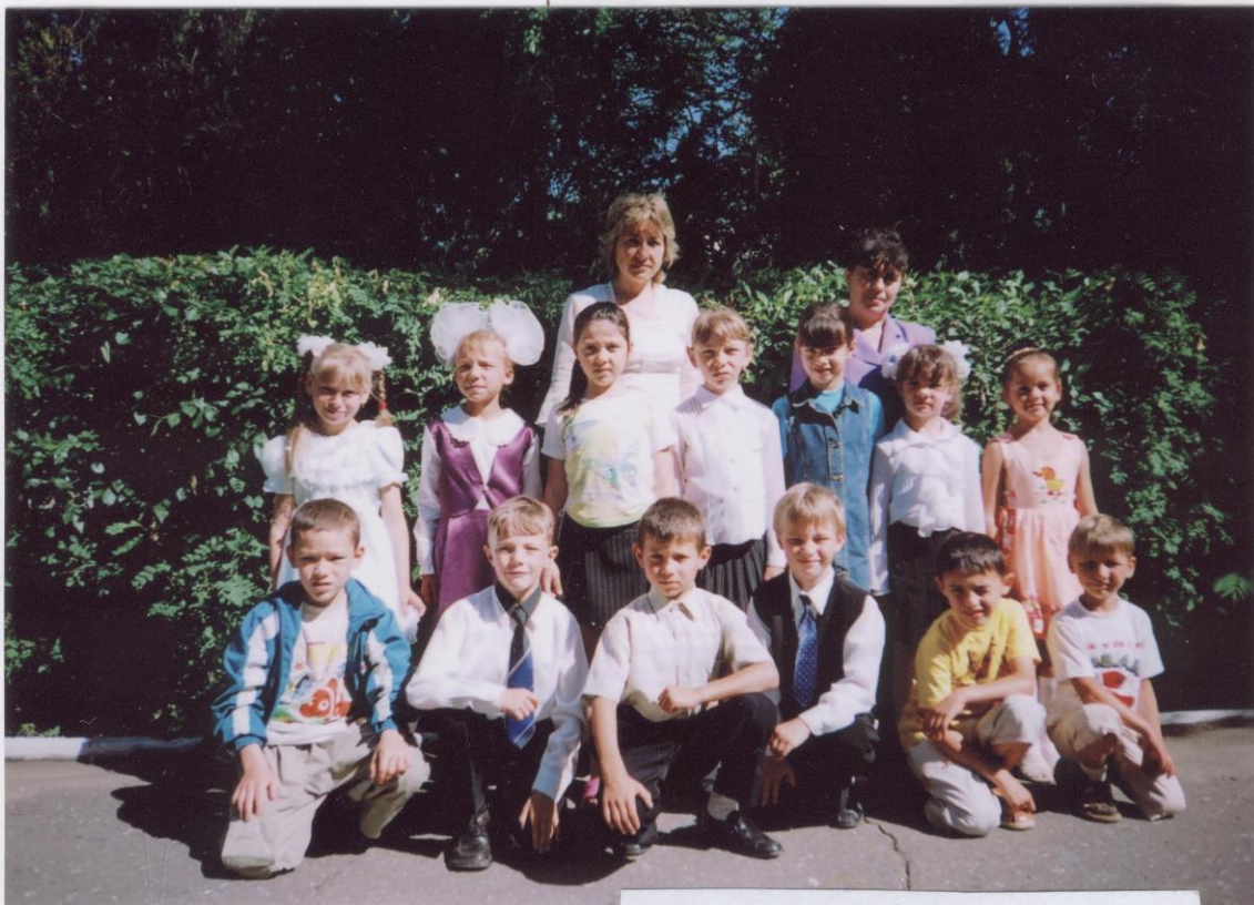
Турлацька Січ. Запис на радіо.