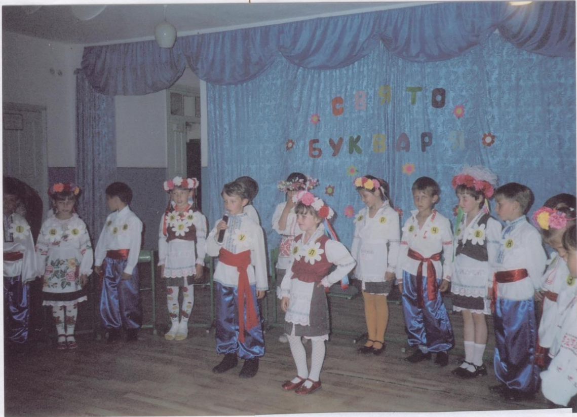
Турлацька Січ. Прощання з Букварем.