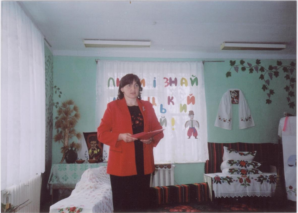
АДАМИВСЬКА СІЧ. ДИТЯЧИЙ САДОК.