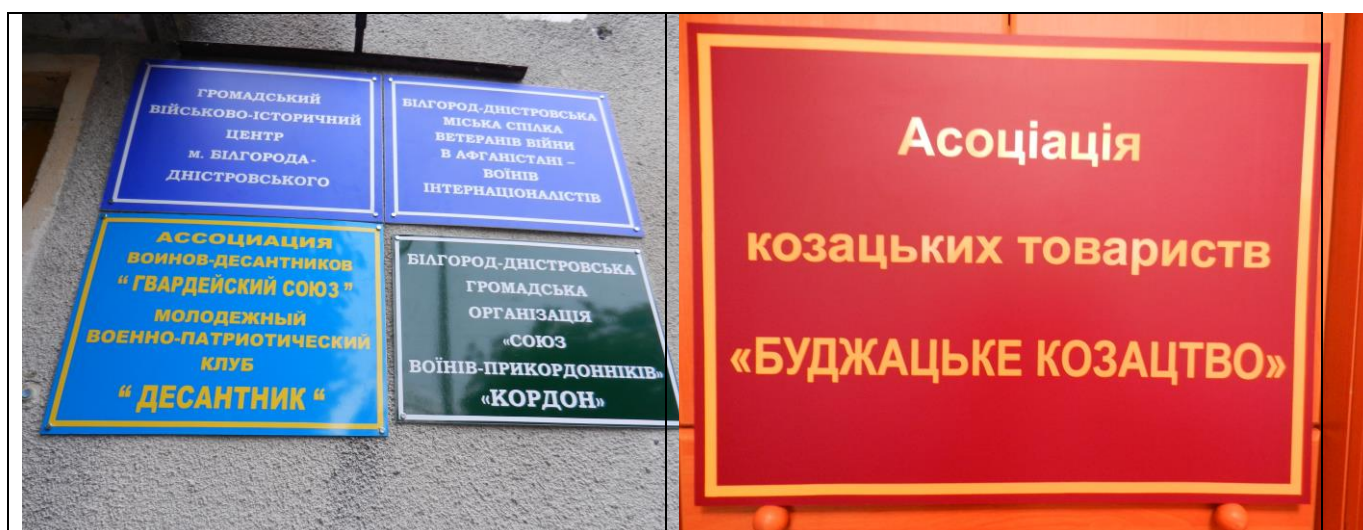
Назви організацій-співзасновників Громадського військово-історичного центру міста.

Готується до відкриття Громадський військово-історичний центр м. Білгорода-Дністровського, до складу якого входять громадські мілітарні організації – Білгород-Дністровська міська спілка ветеранів війни в Афганістані – воїнів-інтернаціоналістів, Асоціація воїнів-десантників «Гвардійський союз», молодіжний військово-патріотичний клуб «Десантник», Білгород-Дністровська організація «Союз воїнів-прикордонників «Кордон», Асоціація козацьких товариств «Буджацьке козацтво» та ін.