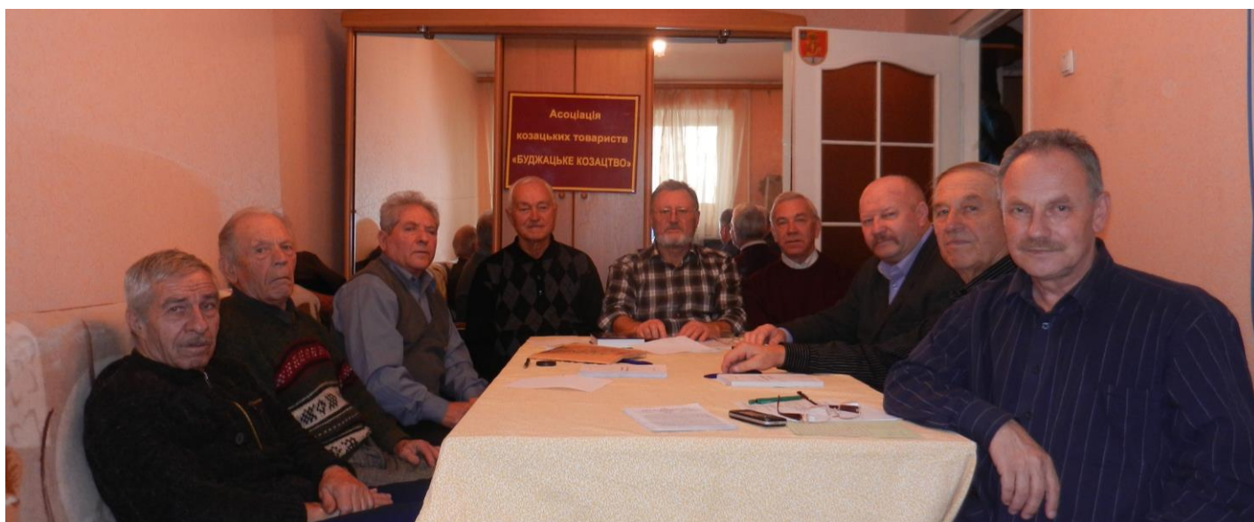
Учасники грудневої Ради отаманів Буджацького козацтва.

Рада розглянула питання щодо участі у 1-й Міжнародній конференції з питань козацької педагогіки (18.12.2015, Київ) і підготовки чергового Кола Буджацького козацтва та Ради керівників громадських організацій козацького спрямування при голові районної державної адміністрації.