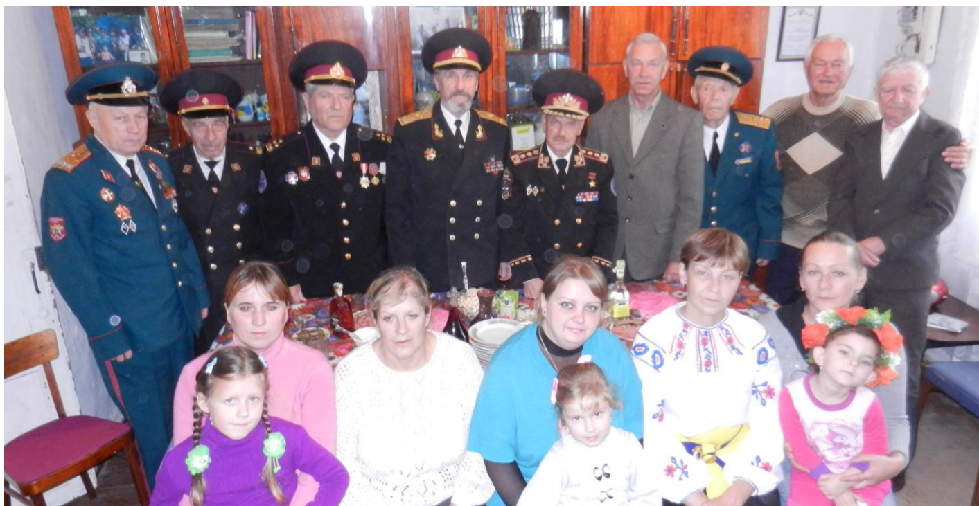
Фото на згадку.