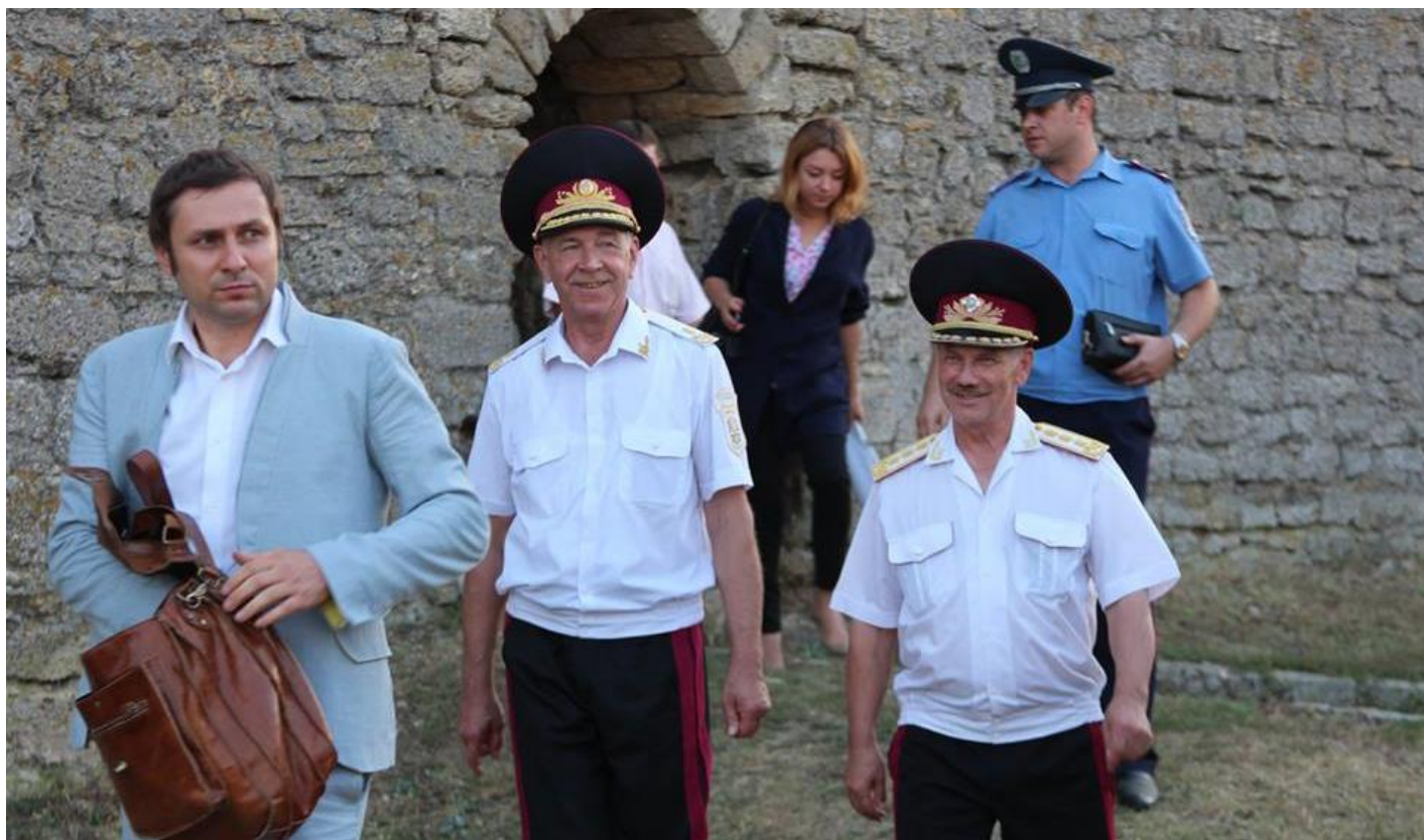
Два козаки – представники Буджацького козацтва на конференції.