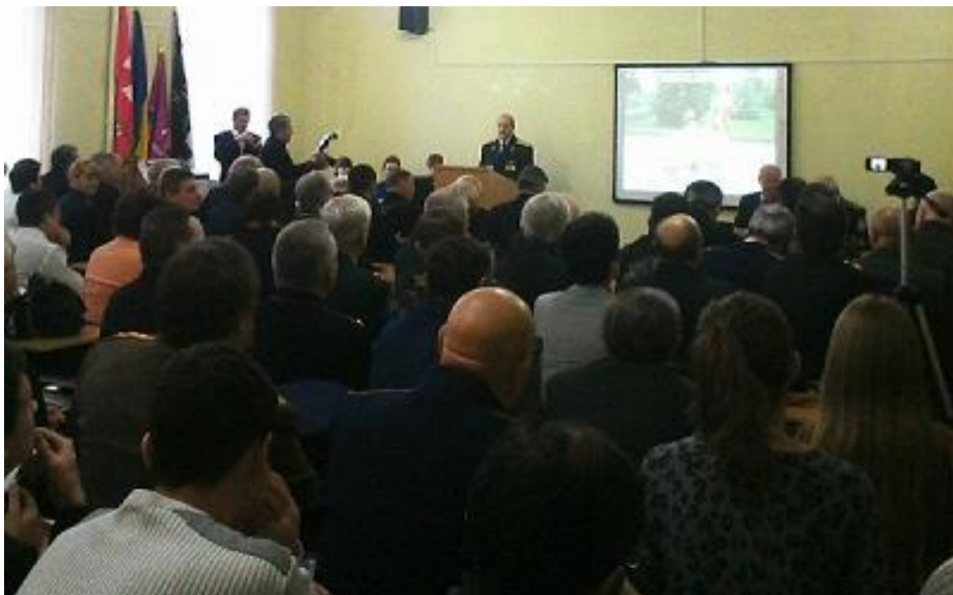
Виступає ректор Харківського НПУ академік І.Прокопенко.

В Харкові відбулася Всеукраїнська науково-практична конференція «Козацький рух на теренах України та патріотичне виховання молоді на його засадах» під патронатом Міністерства освіти і науки України, департаменту масових комунікацій Харківської обласної державної адміністрації, історичного факультету Харківського національного педагогічного університету ім. Г.Сковороди, Національного технічного університету «Харківський політехнічний інститут», Харківського національного університету будівництва та архітектури, Окремого науково-освітнього центру Українського козацтва ім. Г.Сковороди, Харківського науково-дослідного інституту козацтва, Академії військово-історичних наук і козацтва.