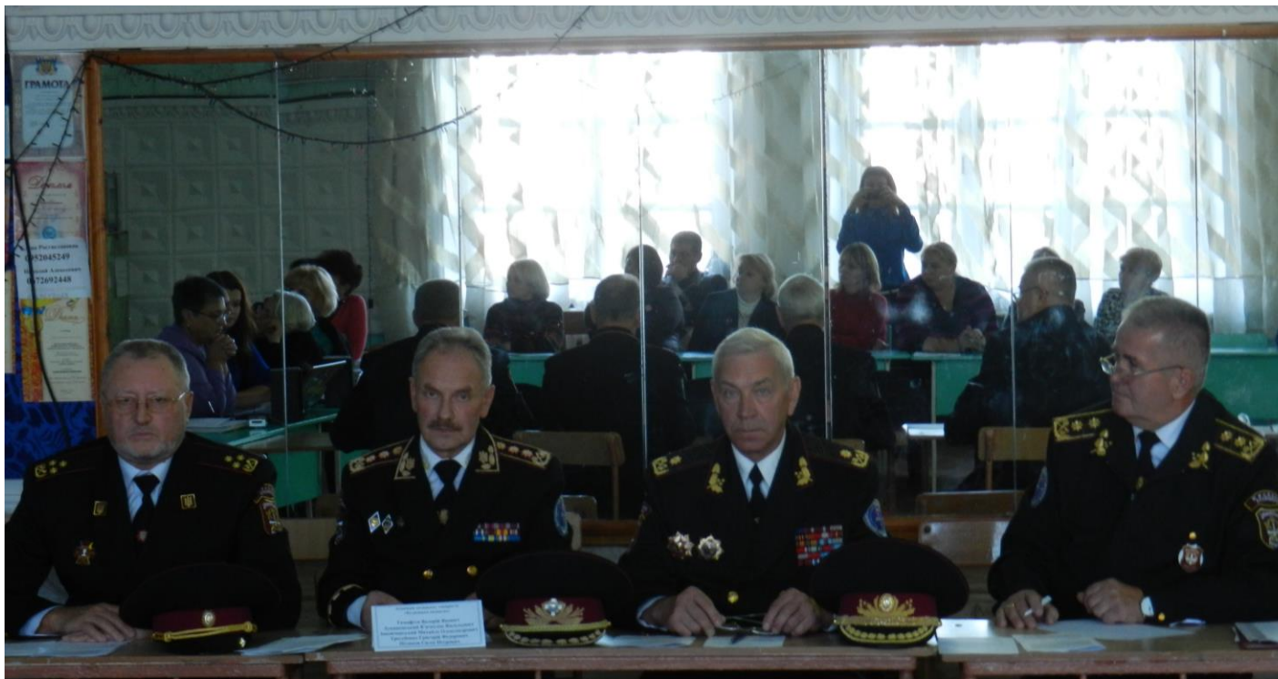
Фото на згадку. Буджацькі козаки на зустрічі із педагогами міста.

думку, є ефективні шляхи, форми і методи національно-патріотичного виховання дітей і молоді? 3. Які були успіхи і невдачі, суспільно-політичні чинники, що сприяли чи гальмували виховання молоді в душі українського державотворення в минулому? 4. Які є ефективні шляхи і форми національно-патріотичного виховання дітей і молоді на традиціях героїв Бродів, Базару, Крут, Холодноярської Республіки, Січових стрільців, вояків УПА? 5. Який статус у національно-патріотичному вихованні дітей і молоді мають займати представники українського націоналізму Микола Міхновський, Євген Коновалець, Андрій Мельник, Степан Бандера, Юрій Шухевич та ін.? 6. Як враховувати вікові, психологічні особливості учнів у процесі ознайомлення їх із бойовими закличками, ідеями «Бог і Україна!», «Слава Україні!», «Героям Слава!», «Слава нації!», «Смерть ворогам!» та ін.? 7. Що треба робити, щоб діти та молодь глибше усвідомлювали терміни «парламентська республіка», «президентська республіка», «козацька республіка», «монархія» та ін.? 8. Який статус мають займати в виховній роботі поняття, терміни «політична освіта», «політичне виховання», «виховання політичної культури», «формування національної ідеології», «ідейне виховання» та ін.? 9. Якою мірою доцільно творчо застосовувати досвід національно-патріотичного виховання цивілізованих народів?