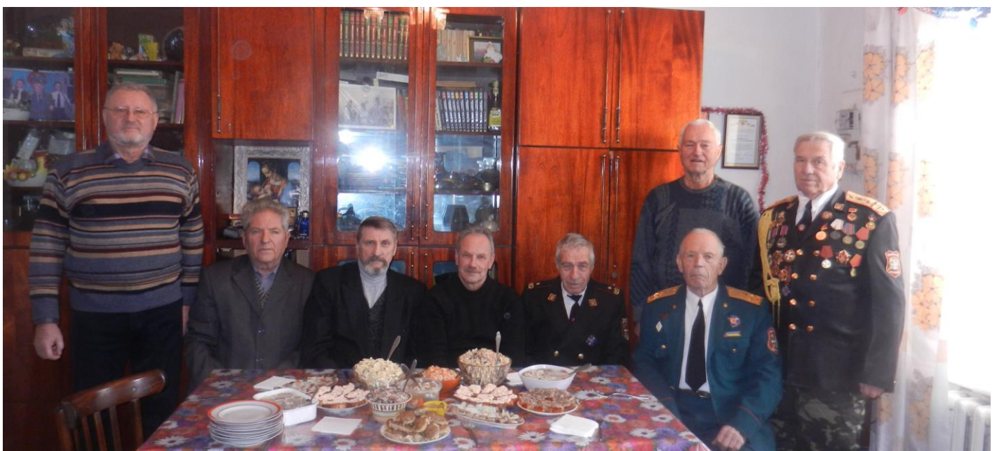
Учасники Ради Отаманів Буджацького козацтва.