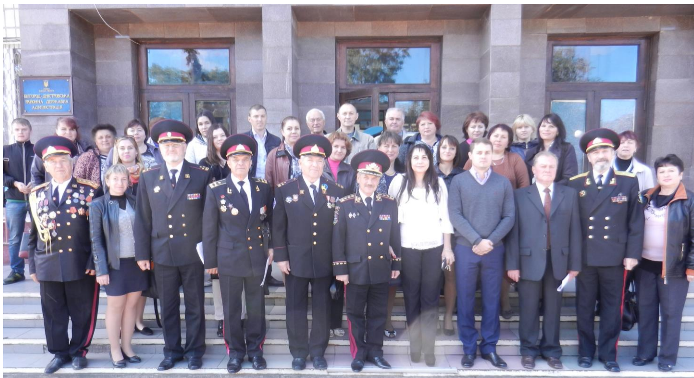
Фото на згадку. Буджацькі козаки із керівництвом та педагогами району.

В районній державній адміністрації та виконавчому комітеті міської ради відбулися круглі столи на тему: «Українське національно-патріотичне виховання дітей та молоді». Круглі столи готували та проводили активісти Буджацького козацтва та працівники методичних кабінетів районного та міського відділів освіти. До участі запрошувались заступники директорів загальноосвітніх навчальних закладів з виховної роботи, педагогічні організатори, керівники громадських організацій патріотичного спрямування, отамани Буджацького козацтва.