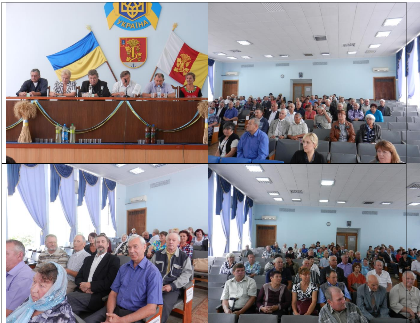
Робчі моменти конференції.