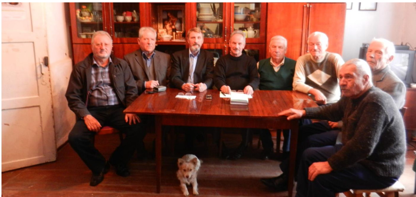
Фото на згадку.

Відбулась Рада отаманів Буджацького козацтва. На порядку денного підготовка та проведення комплексу заходів, що присвячені 25-тиріччю відродженого Українського козацтва.