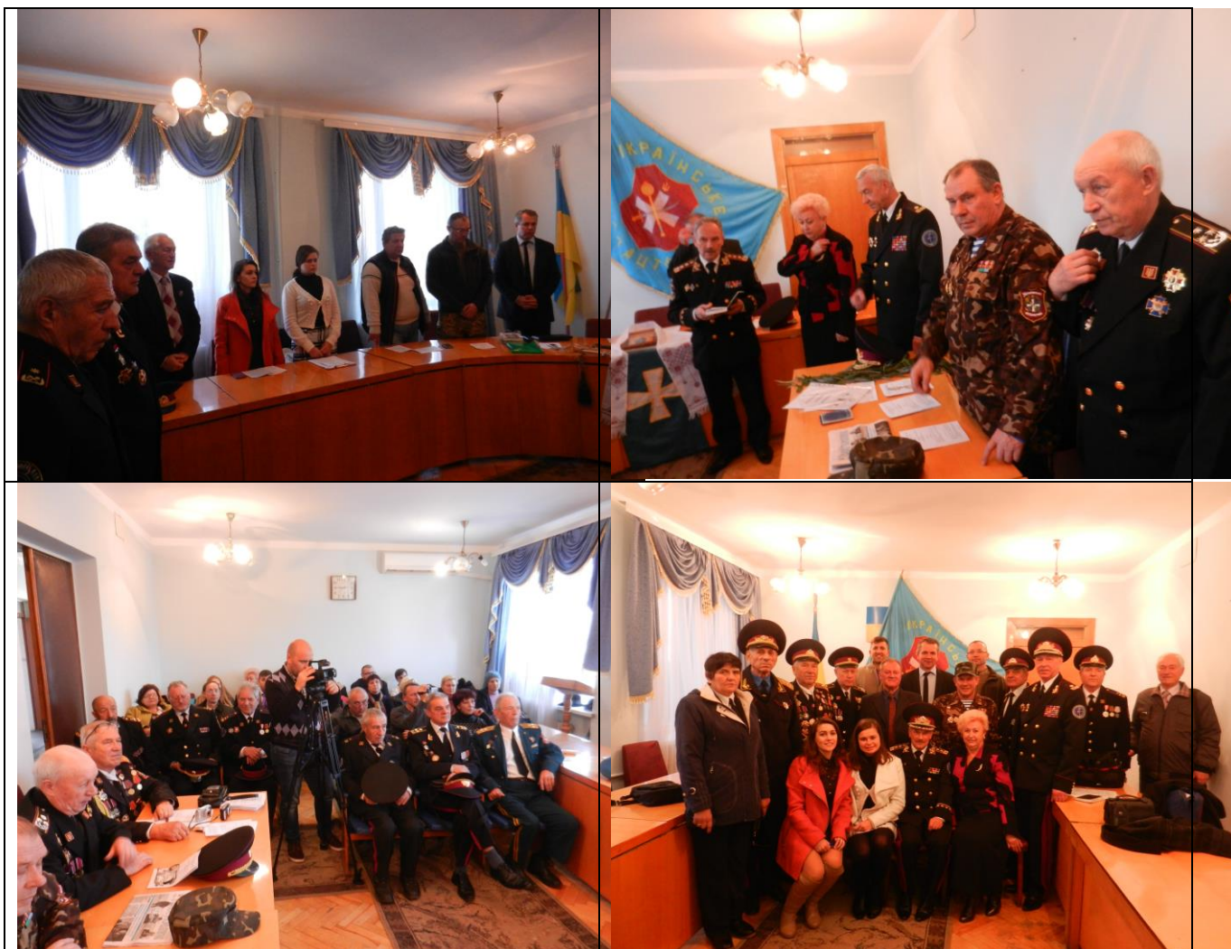
Фото з круглого столу.

В м. Білгороді-Дністровському відбувся круглий стіл на тему: «Буджацьке козацтво: історія та реалії сьогодення – стратегія розвитку».